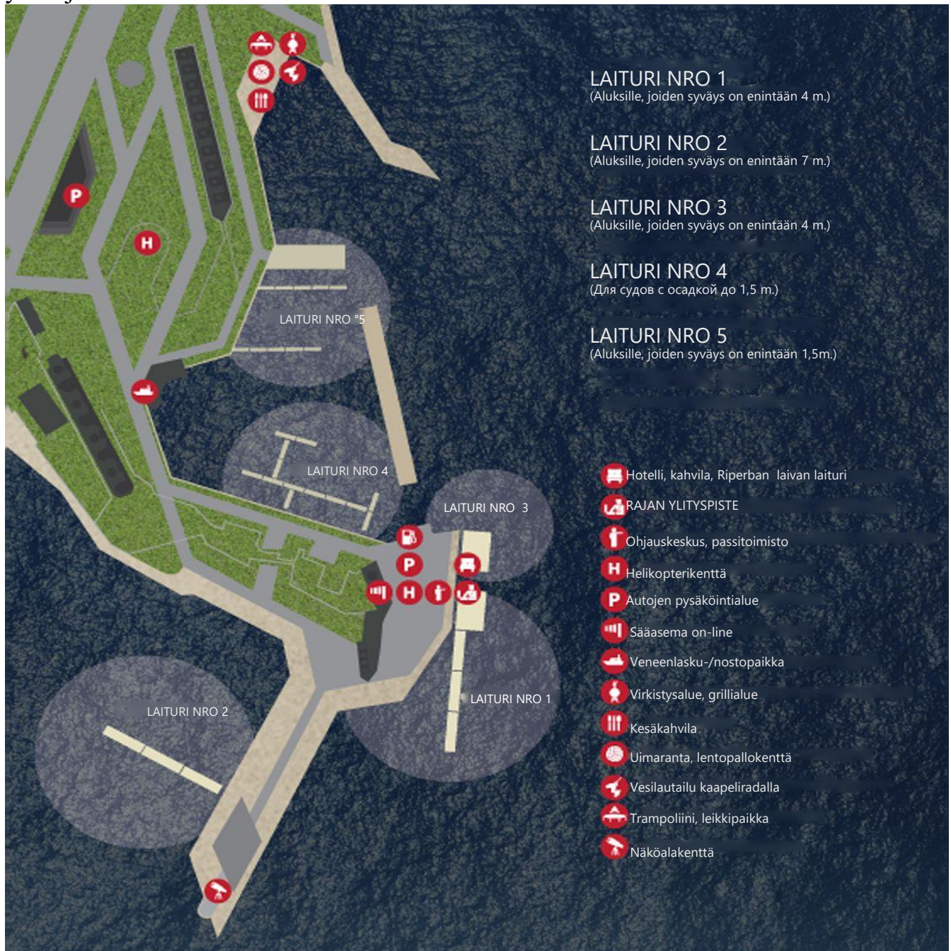
Kartta tarkastuspisteiden sijainnista satamassa Pietarin Suursatama

Terveyst- ja karanteenitarkastuksen tulokset todetaan siten, että kuljetusasiakirjoihin laitetaan asianmukaiset leimat ja Venäjän federaation lainsäädännön edellyttämässä tapauksissa laaditaan myös asianmukainen pöytäkirja.